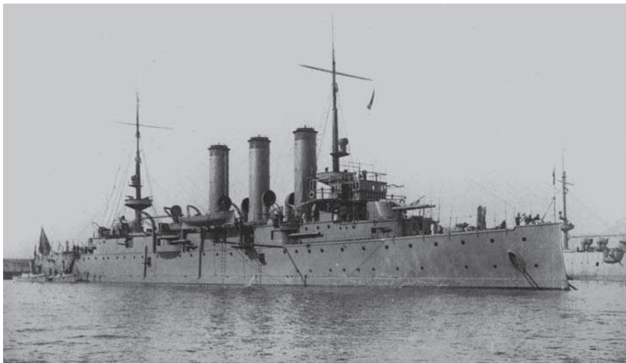
Crucero protegido Reina Regente , enviado por España al Bósforo en noviembre de 1912.

y Méndez (3), primero, y después por Álvaro Figueroa y Torres, conde de Romanones (4), decidió el envío al Próximo Oriente —y posterior permanencia— del crucero Reina Regente , que en aquella época era el mejor barco de guerra operativo y el más moderno de la Armada.