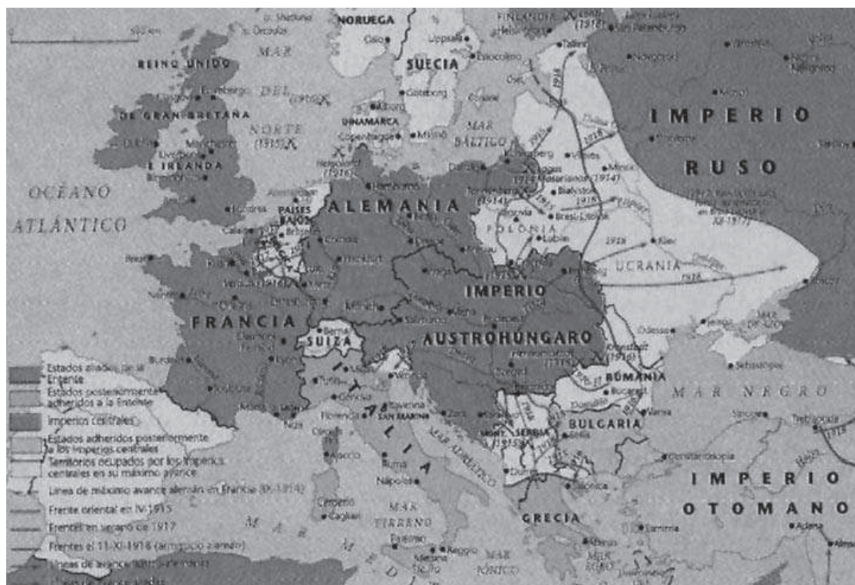
Europa en los inicios de la Primera Guerra Mundial y frentes abiertos. (Foto: Internet).

Estonia, Lituania, Letonia y Yugoslavia. Austria y Hungría se separaron definitivamente en dos Estados. Por lo que se refiere al papel que asumió la flota internacional reunida en el estrecho del Bósforo en su misión de neutralizar el mar Negro e impedir que el conflicto de los Balcanes se extendiera, resulta notorio que propició el acuerdo de numerosos Estados nacionales europeos — entre ellos grandes potencias imperiales —, que de facto tenían intereses muy diversos, pero que también fueron capaces en aquel momento tan difícil de aunar fuerzas con un mismo objetivo: preservar la paz. Lamentablemente y como nos enseña la Historia, aquellas naciones pronto serían beligerantes entre sí, anteponiéndose una vez más e irremisiblemente los hechos a los esfuerzos políticos y diplomáticos.