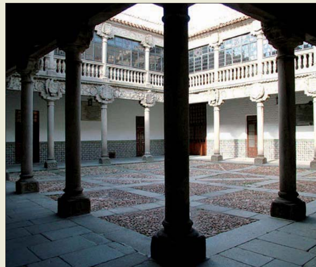
Patio del Palacio de Polentinos, sede del Archivo

Dentro de la estructura del Subsistema Archivístico del Ejército de Tierra, en el Palacio de Polentinos se conserva actualmente la documentación más contemporánea, con excepción de los expedientes personales.