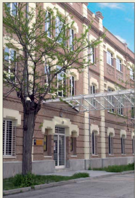
Fachada principal del Archivo

Para finalizar, el Archivo dispone de una colección de 12.069 fotografías antiguas, fechadas entre 1854 y 1936.