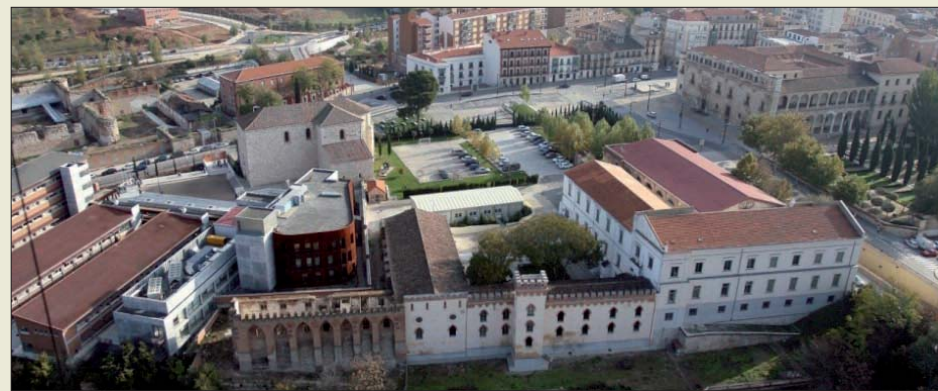
Vista aérea de las instalaciones del Archivo General Militar de Guadalajara

Otros de los fondos que se encuentran disponibles en Guadalajara son la documentación relacionada con las Milicias Provinciales de Canarias, los expedientes personales de las unidades, centros y organismos disueltos, los testimonios del Consejo Supremo de Justicia Militar y los expedientes de la Dirección General de Mutilados.